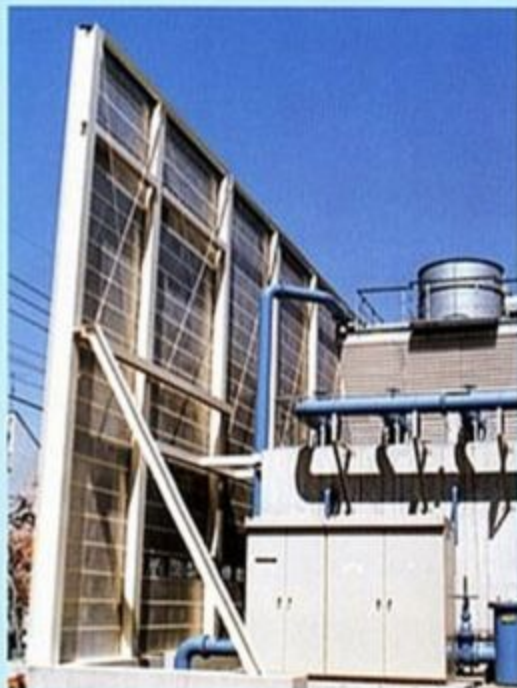
▲民家に対する防音壁