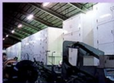
▲モーターコア工場