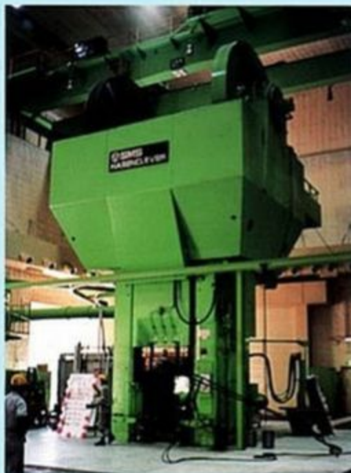
▲大型スクリュープレスの防振